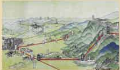
信貴山名所図会(部分)館蔵