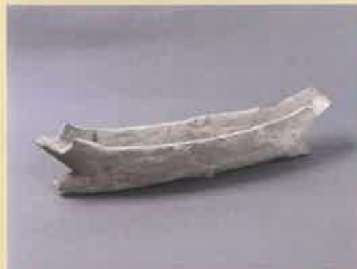
中田古墳出土 船形埴輪(八尾市指定文化財) 長さ35.2cm 幅7.7cm 高さ7.9cm

4世紀後半に造られた中田古墳から出土しました。小型の船形埴輪です。船形埴輪の出土例は少なく、中田古墳の被葬者は、周辺の水運を掌握していた人物であったと考えられます。(もうちょっと詳しくは当館HPお・き・に・い・りへ！)