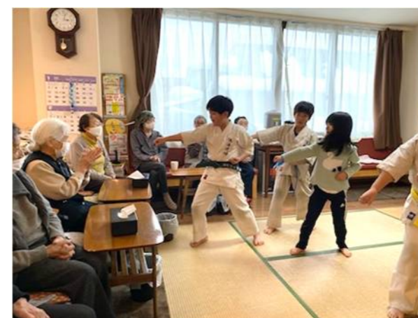
空手道 鳴海道場 小学生の演武

引き続き、当法人では地域交流を図りながら、ご利用者がその人らしく在宅生活を送ることができるよう支援してまいります。