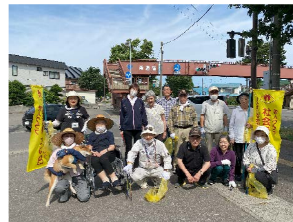
南造道老人会 一掃きデー参加

グループホーム デイサービスセンター ケアマネジメントセンター の、活動内容をご紹介します。