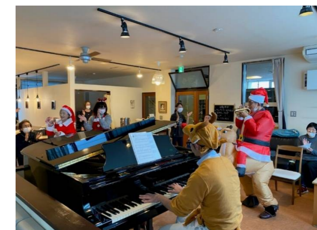
あおりちンドン クリスマスライブ