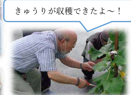
きゅうりが収穫できたよ～！