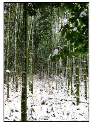
「白き朝」 （徳島県立中央病院） ／工藤英治先生

対象：医師・歯科医師 期間：2021年2月19日、3月19日、 4月16日、5月21日、6月18日 予定(計5回)毎月第3金曜日(月1回) 時間：19:00～21:00 参加費：会員1万円、研修医無料 ※撮影会イベント等への参加費は別です。 持参品： 講評・アドバイスを受けたい写真を 毎回15枚程度 （データの入ったUSB メモリ、SDカード、2L版の写真等） 会場：フコク生命ビル第2会議室 徳島市幸町1-44 フコク生命ビル2F ※状況により会場変更となる場合があります。 問合せ先：徳島県保険医協会事務局 電話 088-626-1221 メール tokushima@doc-net.or.jp