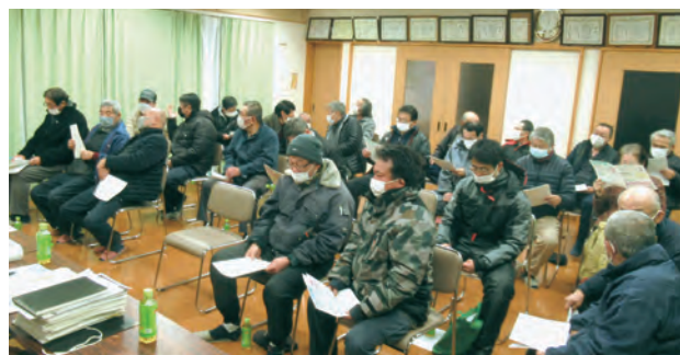
▲清水地区換地設計基準地区説明会