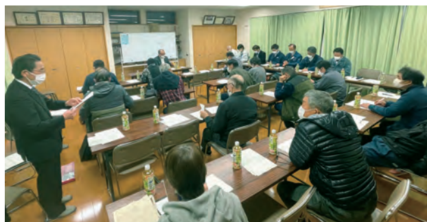
▲清水地区法人化研修会