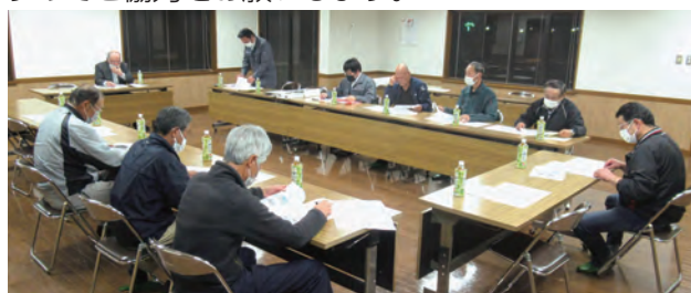
▲中嶋・上高城地区推進委員会

受託調査では、土壌調査や現況調査を行い区画や水路の配置を定めた基本計画や地区の具体的な営農ビジョンを描いた促進計画書を作成し、事業採択に向けての計画概要書を作成します。その後、本同意徴収で全員から同意が得られれば土地改良法手続きを行い、早ければ令和9年度に事業採択となりますのでご協力をお願いします。