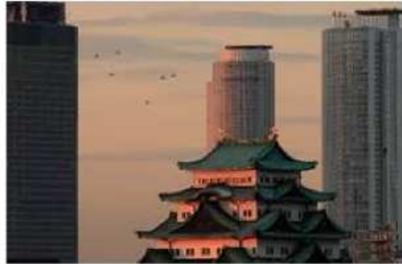
名古屋城と、背後にはミッドランドクスエア（左）、JRセントラルタワーズがそびえる。

その流儀、味、産業、芸事、言葉、歴史、さまざまな視点から名古屋を総点検。その元気力の源を探った、待望の出版！