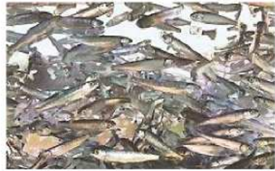
ぐんぐんと成長し放流を待つばかりとなった〇〇の稚魚=19日、石川県白山市の県水産総合センター美川事業所で