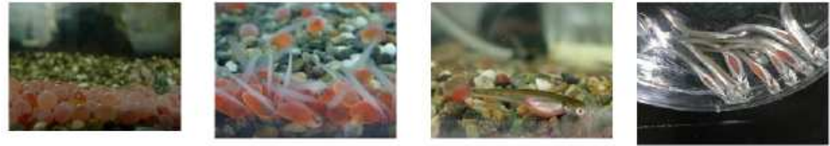
【下記画像は HP:大きくなあれ!サケっ子より】

石川県白山市の県水産総合センター美川事業所で、昨年暮れからふ化を始めた〇〇の稚魚がすくすくと育っている。今月末から手取川支流に放流される予定で、稚魚たちは、銀色の腹をひるがえして屋外水槽を元気に泳ぎ回り、春の訪れを待っている。