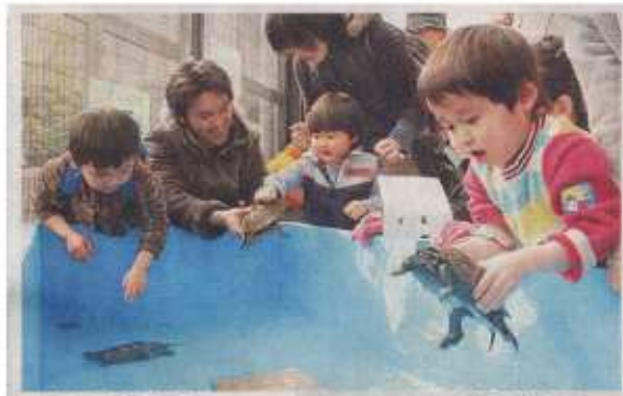
カメに触れ、笑顔の親子連れたち= いずれも石川県能美市のいしかわ動物園で

石川県能美市のいしかわ動物園で21日、カメなど小動物との触れ合いが楽しめる「なかよしハウス」がオープンし、大勢の親子連れらでにぎわった。また、屋外展示場では、シロテテナガザルの赤ちゃんも一般公開され、愛らしい姿を見せた。(能美通信部・田嶋豊)