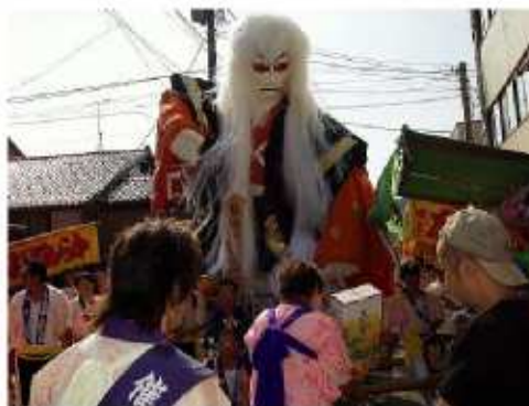
白山市の金劔宮秋季祭

石川県白山市の金劔宮秋季祭「ほうらい祭り」（市無形民俗文化財）が六日、同市鶴来地域で六日と七日の日程で行なわれた。「造り物」と呼ばれる高さ五メートルの巨大人形や獅子舞の「棒振り」が、旧鶴来市街地を練り回り夜遅くまでにぎわった。同日正午すぎ、若い衆が担いだみこしが金劔宮を出発し、巡行がスタート。あでやかな芸者の舞を表現した「駒富士の舞」や米俵を担いだ「徳川吉宗」など、造り物五基と獅子舞三組が続いた。