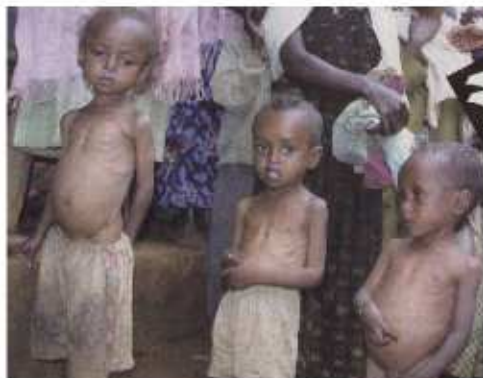
飢えが原因で毎日、5歳未満の子ども1万8000人が亡くなっている(エチオピアで)