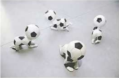
23日朝刊 金沢版掲載