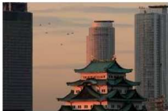
名古屋城と、背後にはミッドランドクスエア（左）、JRセントラルタワーズがそびえる。

その流儀、味、産業、芸事、言葉、歴史、さまざまな視点から名古屋を総点検。その元気力の源を探った、待望の出版！