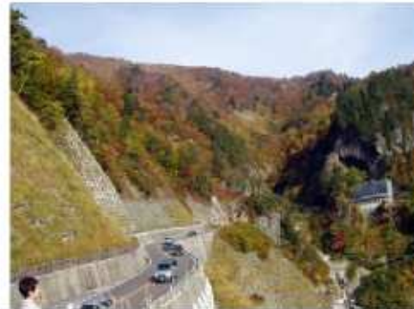
白山スーパー林道 「紅葉」