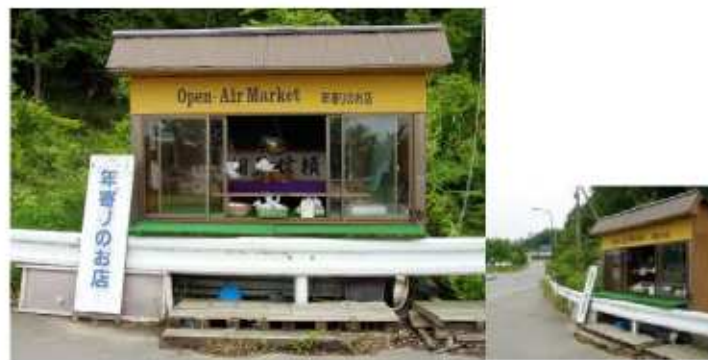
お年寄りのお店「無人販売」

『北陸中日新聞中山新聞舗HP』、CCC鶴来中央と合わせて、どうぞ直しくお願ひします。地域情報交換の場として大いに活用してください。盛り上がっていきましょう！！ (…いえ、…どうか、ご協力のほど、直しくお願ひいたします…みなさまのご参加待っています。)