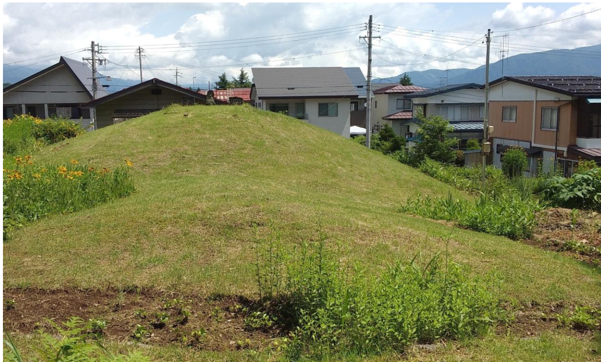
第2図：飯山市史跡の飯山市大字静間の法伝寺 2 号古墳

余談にはなるが、発生期前方後円（方）墳は全長 20m内外の小規模のものが全国的に多数あり、前の段階の前方部祖形型古墳から文化的に変化してきたものであり、飯山市の法伝寺 2 号古墳、勘介山古墳、有尾 1 号古墳は前方部確立型古墳に含まれ、発生期前方後方墳かその系列上に存在する古墳の可能性が高い。背後にある政治的関連は現在つかめないが、統一政権に向かう動乱時代の文化波及の 1 現象と把握できようか。