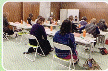
第1回サブリーダー会議の様子