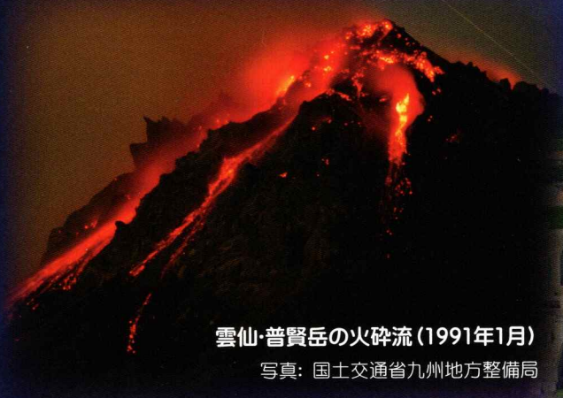
雲仙・普賢岳の火砕流(1991年1月)

◎京阪「守口市駅」東口から徒歩2分 守口市河原町8-22 TEL.06-6992-1276