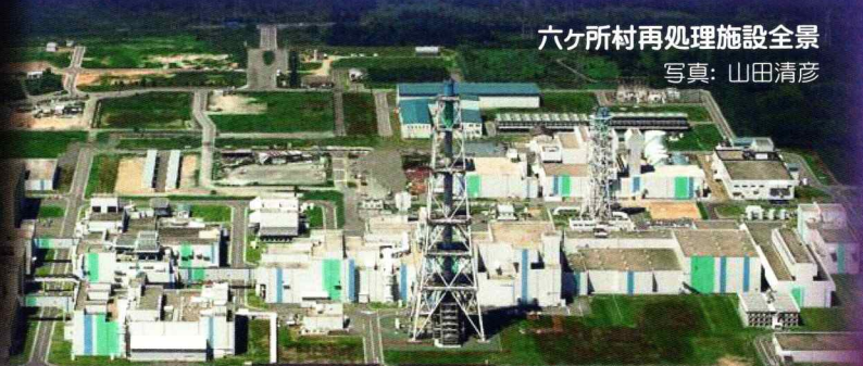
六ヶ所村再処理施設全景