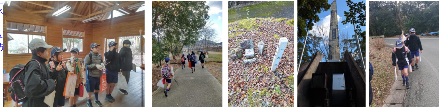
1/13 ボーイ隊 課題ハイキング 龍王城址を目指して 三角点 忠魂碑 ゴミ袋を持って