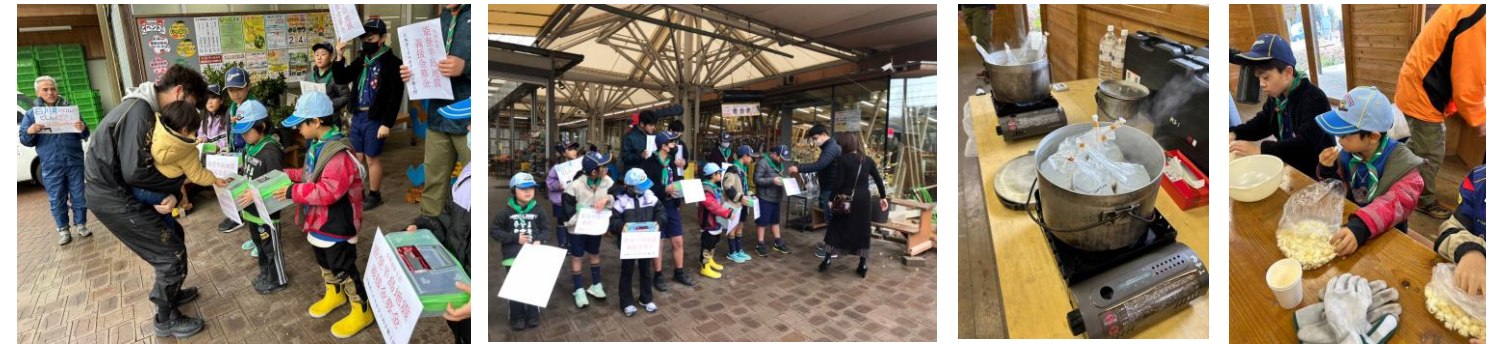
ご協力ありがとうございました