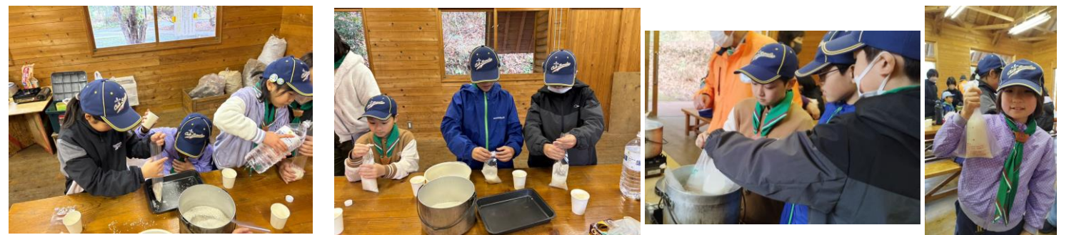
ポリ袋でのご飯炊き(お米と水の量を計算します。米1:水1.2。無洗米は水1~2割増し) できました