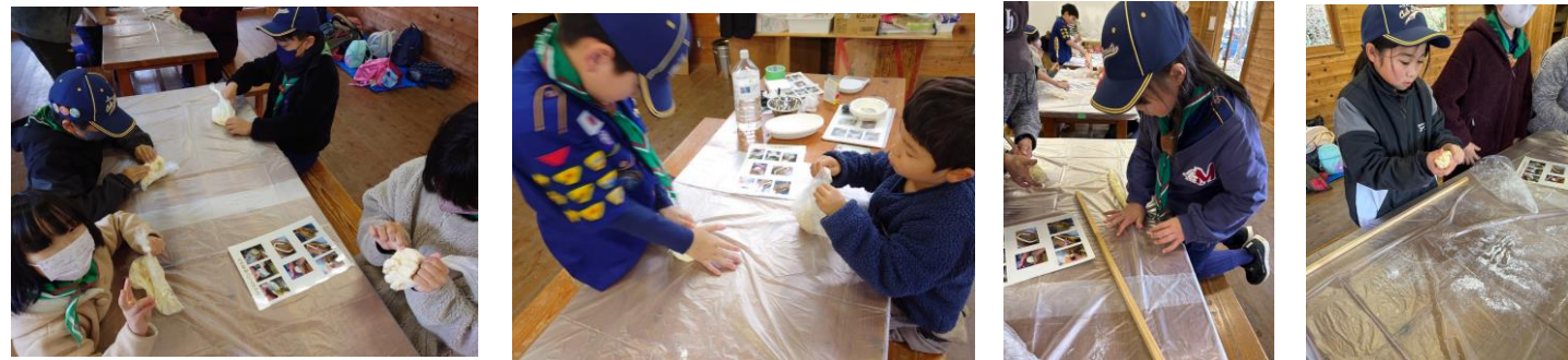
12/23 土曜部ツイストパン作り 袋に材料を入れてこねます 手で伸ばして、棒に巻き付けます