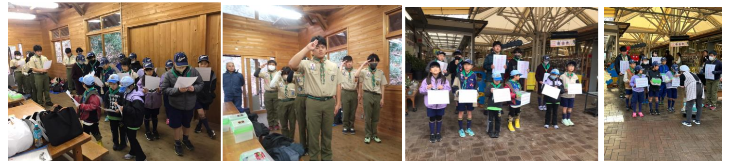
1/20 能登半島地震義援金募金活動 「内子フレッシュパークからり」にて募金活動