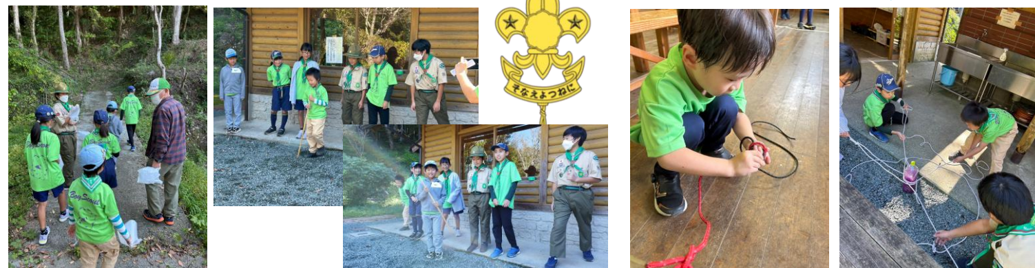
10/12 ボーイスカウト土曜部の活動 棒とり