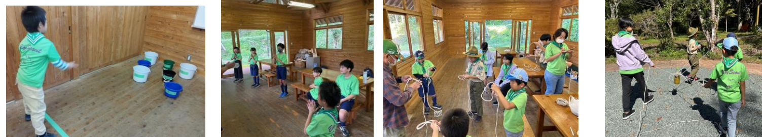
ドングリ・松ぼっくり入れ