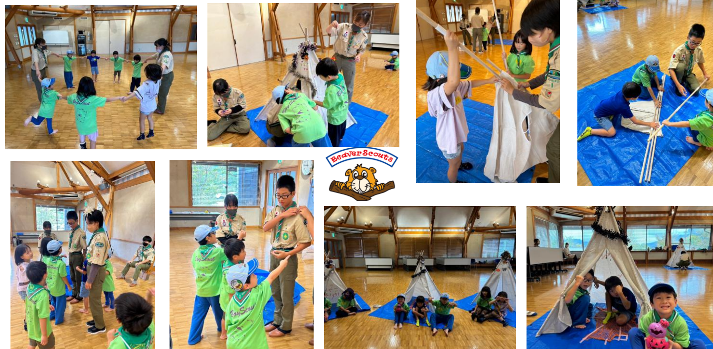
10/5 ビーバー隊の体験集会「ひみつきちを作ろう」キッズテント張り、飾り付け