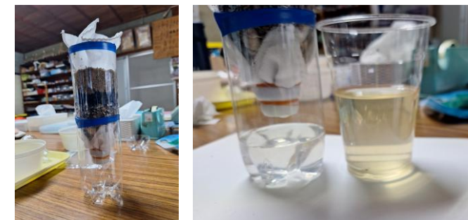
10/16・18 ボーイスカウト中学部 1次ろ過した泥水(1)を、簡易ろ過器(左側写真)で、ろ過した水(右ろ過前、左ろ過後の水) ⇒