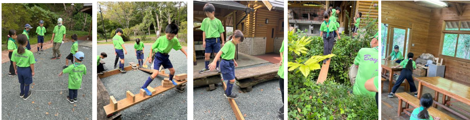
9/28 ボーイスカウト土曜部の活動 板渡り