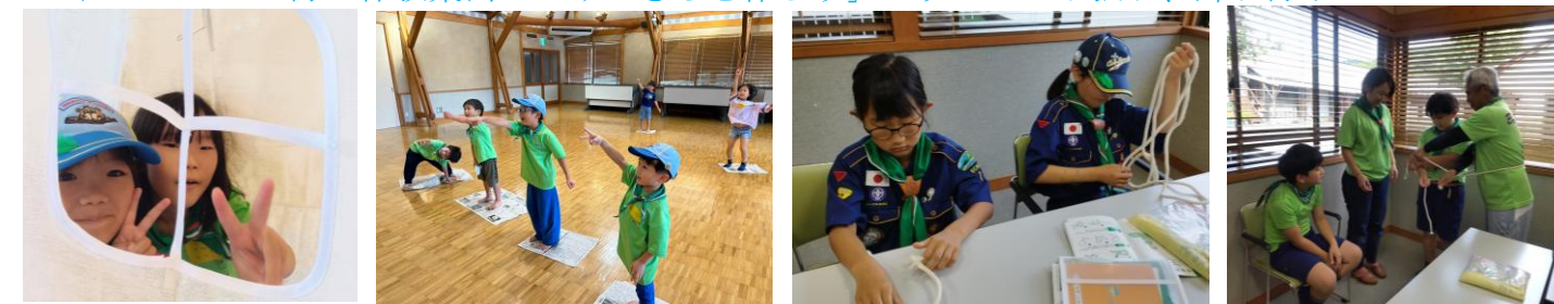
ひみつきちの中から