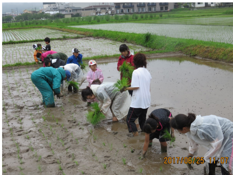
【平古子ども会田植え体験】