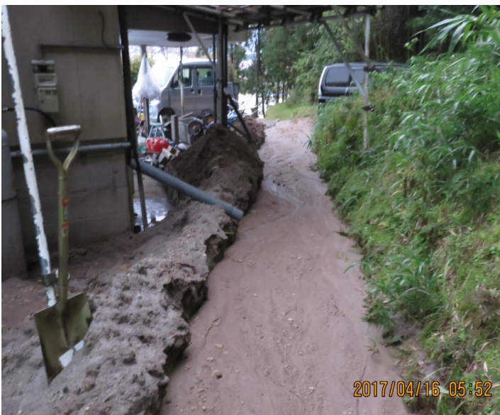
↑ 大雨により民家に土石流発生