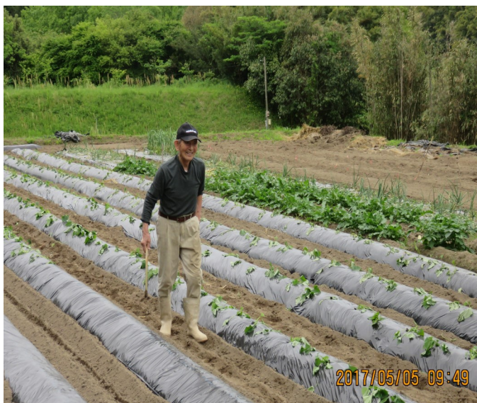
【健康の秘訣 家庭菜園づくり】