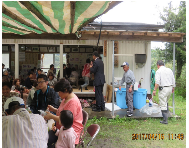
↑ 四郎園自治会交流親睦会