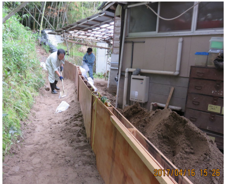
↑ 土石流簡易対策(隼ぶさ隊出動)