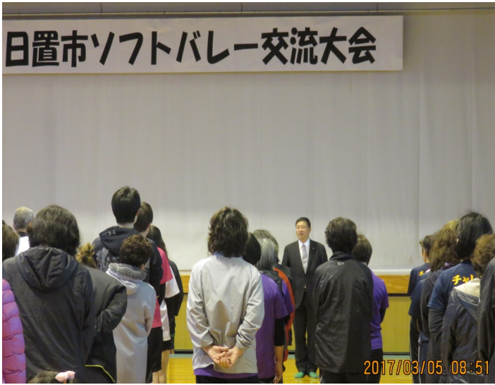
↑ 日置市ソフトバレー交流大会