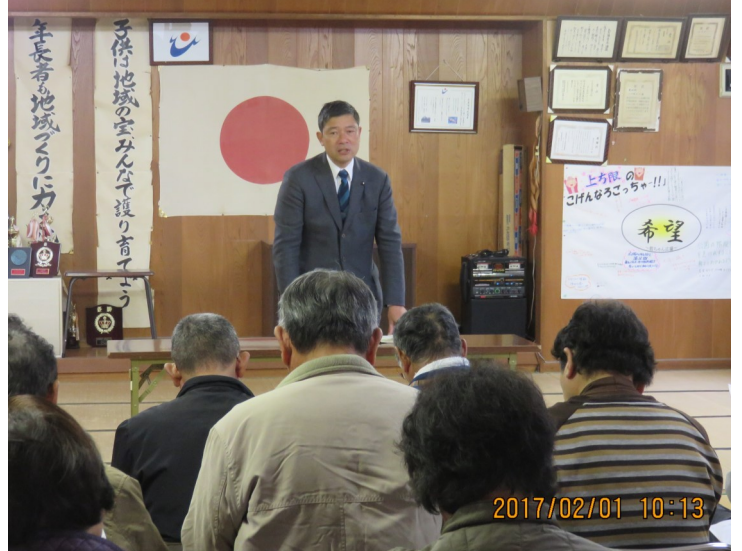
↑ 上方限自治会にて県政報告会並びに語る会