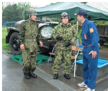
↑ 熊本地震現地調査