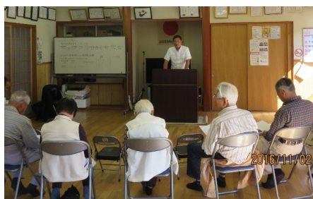
↑ 各地区の県政報告会並びに語る