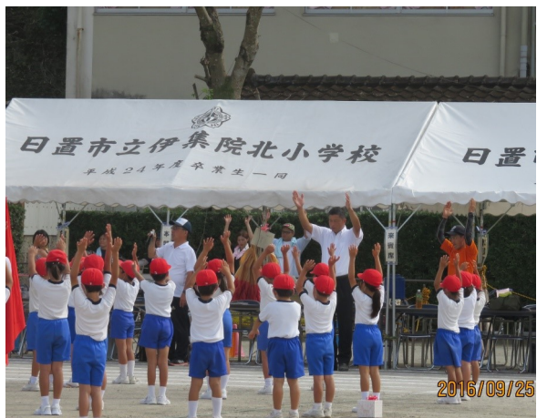
↑ 伊集院北小学校運動会 子ども達からたくさんの元気もらいました！