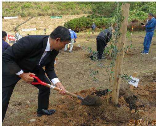
↑ 鹿児島地域植樹祭にてオリーブの木を植えさせて頂きました。