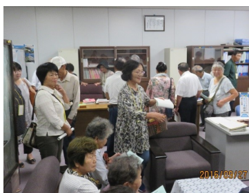
↑ 無所属の部屋を見学