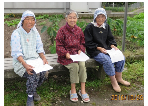
↑ 恋之原の仲良し三人衆です。