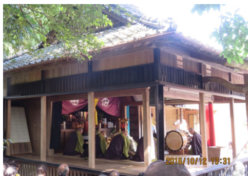
↑ 妙音十二楽演奏会 歴史ある演奏を聴くことができました。