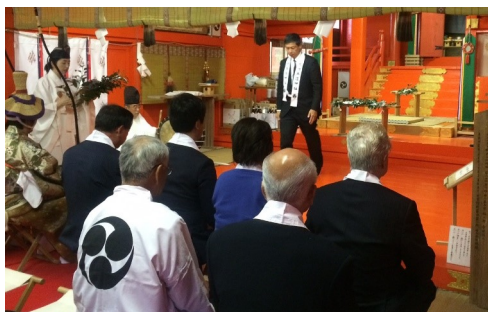
↑ やぶさめ 流鏝馬神事に 参加させて頂きました。