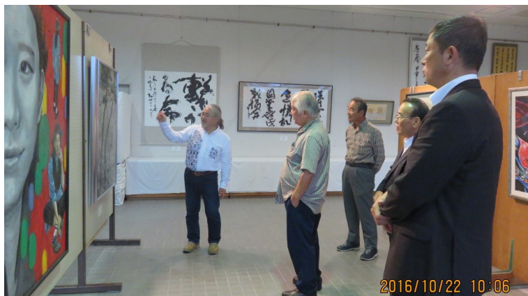
↑ 第1回日置市美展では、芸術性の高い作品に 目を奪われました。