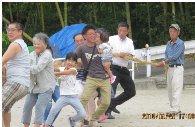
↑ 徳重十五夜での手作り大綱です。