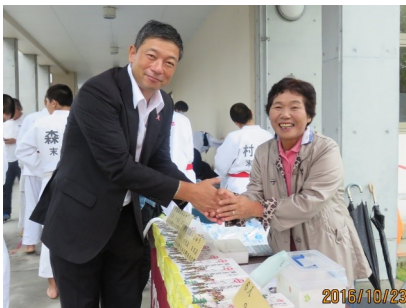
↑ 妙円寺詣りにて、美味しいいじゅういん饅頭を売っていた方と