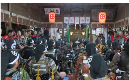
↑ 妙円寺詣り武者行列に鎧を着て参加