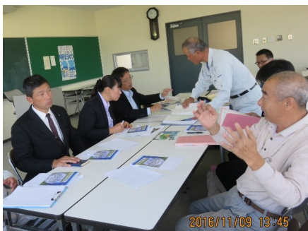
↑ 吹上浜の環境改善について