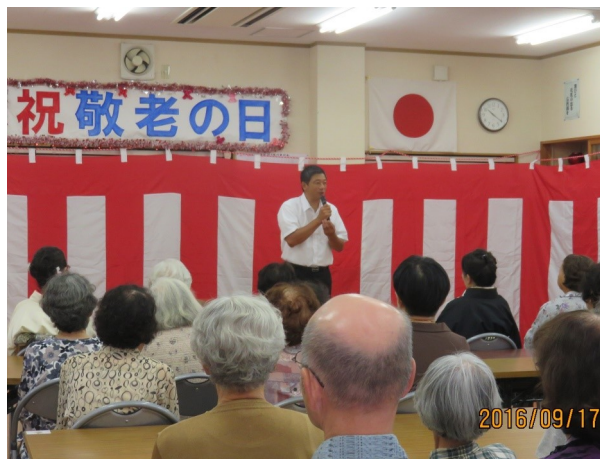
↑ 猪鹿倉自治会敬老会