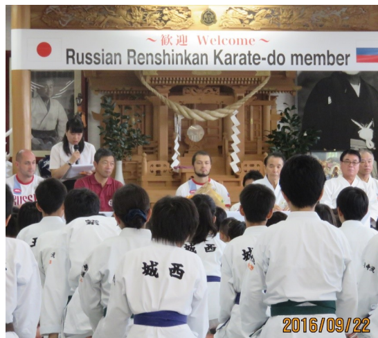
↑ 少林寺錬心館昇段試験 ロシアの方との交流もありました。