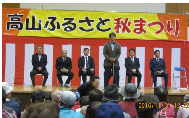
↑ 高山ふるさと秋まつりに参加