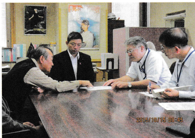
下神殿の方々と地域振興局へ陳情・要望

平成28年2月に一般質問をさせていただきました。何か県に対して質問・要望等ございましたらご連絡よろしくお願い致します。