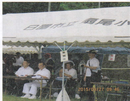
扇尾小学校最後の運動会