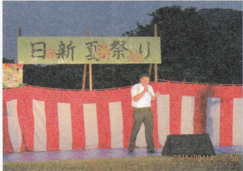
夏祭りで飛び入り参加し 「桜島」を熱唱