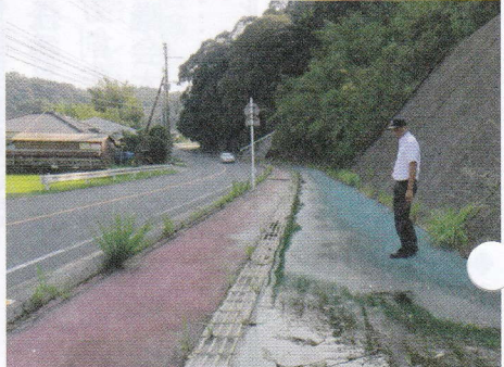
歩道に流れる漏水の現場確認 即 改善いたしました。