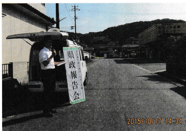
各地域にて県政報告