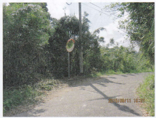
県道291号線にロードミラーを設置