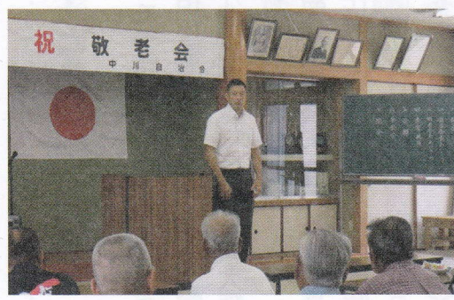
各自治会の敬老会にて