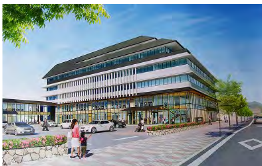
▶ 市役所の改築改修も進みます