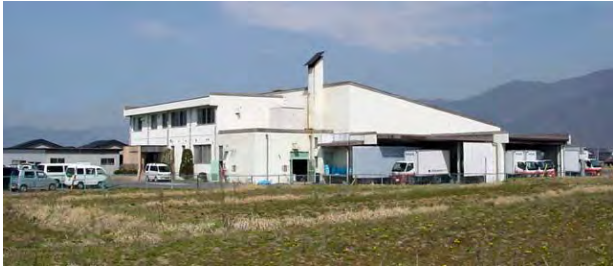
▶ 更新予定の第二給食センター