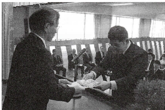
令和元年度 卒業式

新型コロナウイルス感染防止のために、卒業式・入学式ともに、出席人数を制限した上で行われました。