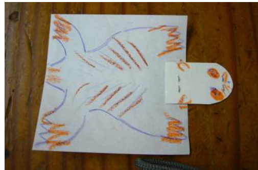
折り紙モモンガー