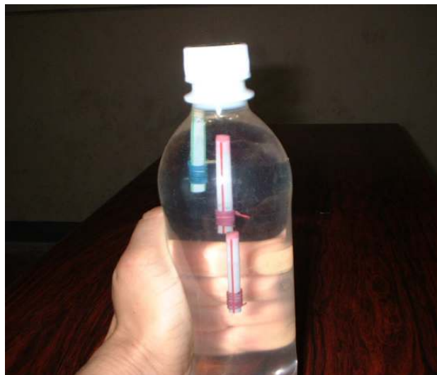
太郎さん、次郎さん、三郎さん

太郎さん下がれ、次郎さん上がれ、三郎さん止まれ。三つの浮沈子を上手にあやつってください。