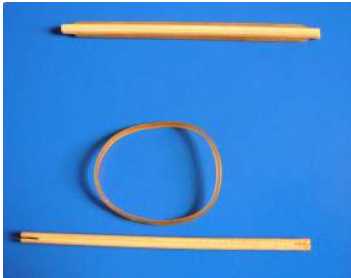
棒と輪ゴムの基本セット

輪ゴムと真っ直ぐの棒を用いて、棒同士を触れさせないで頑丈な構造物を作ってください。次に、輪ゴムを糸で置き換えてみよう。棒の数が3本から90本までの見本があります。