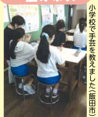
小学校で手芸を教えました(飯田市)