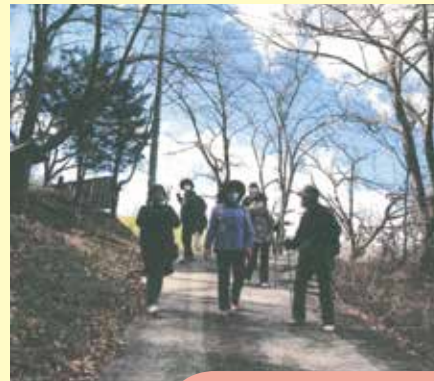
芦田城跡を目指し健康ウォーキング (北佐久郡)