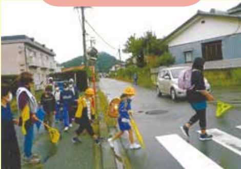
毎月11日はあいさつ運動(千曲市)