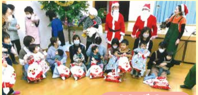
未就園児親子さんとの集い (岡谷市)