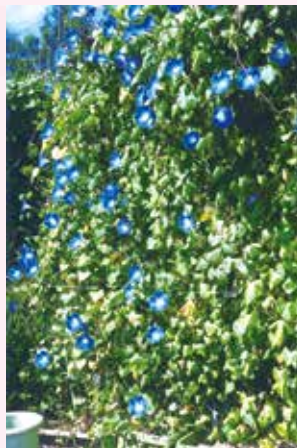
プランターで育てたアサガオが2階まで到達