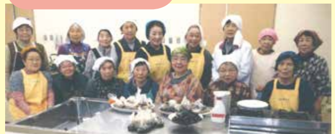
お正月に向けおまめと昆布のお料理教室(諏訪郡)