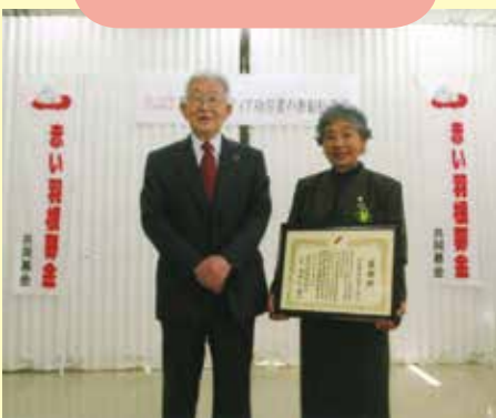
長年の共同募金活動に感謝状(須坂市)