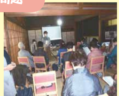
「不都合な真実」環境ドキュメンタリー映画上映会(上市市)