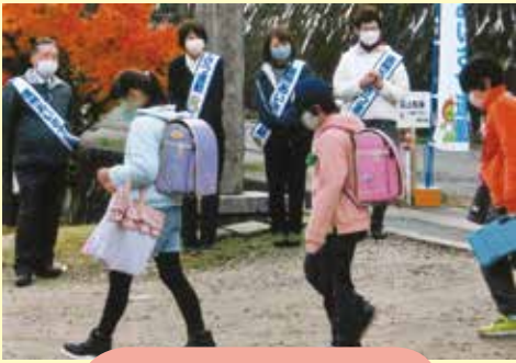
マスクでも元気に あいさつ(下伊那郡)