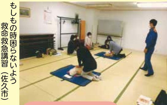
もしもの時困らないよう 救命救急講習(佐久市)