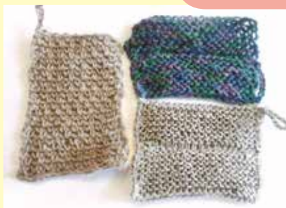
自然素材を使った エコたわし作り(上水内郡)