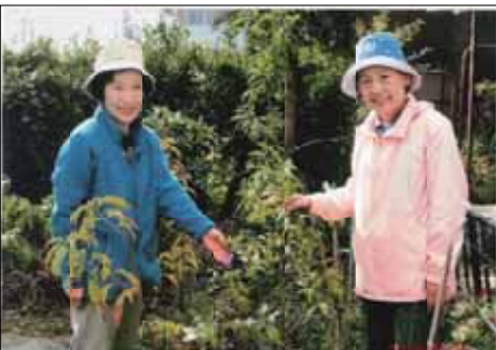
全国植樹祭を間近に控え、「苗木のホームステイ」のハナモモの苗が大きく育ちました。 諏訪郡連合婦人会のみなさんです