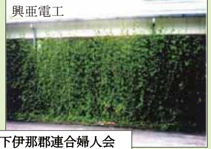
下伊那郡連合婦人会

阿南支部：婦人会員50名・老人会60名がディサービスセンター・かじかの湯・興亜電工・消防署に室内と室外の温度差2℃のカーテンをプレゼント。