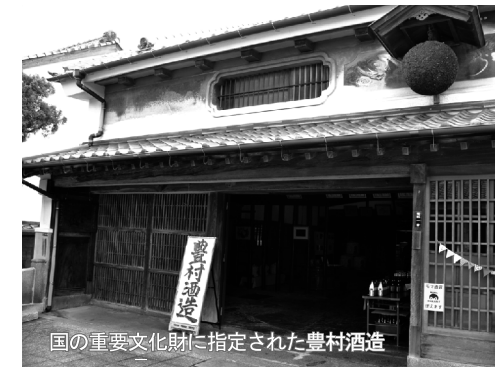
国の重要文化財に指定された豊村酒造

進する中で漁獲量の変動等も把握し、漁業者の所得の向上を目指していきたい。商工分野ではすぐに経済効果は出るものではないと思っている。