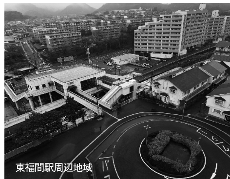
東福間駅周辺地域

しかし当初掲げたにぎわい再生という面から公園や駅前広場を市民が活動できるスペースとして検討している。