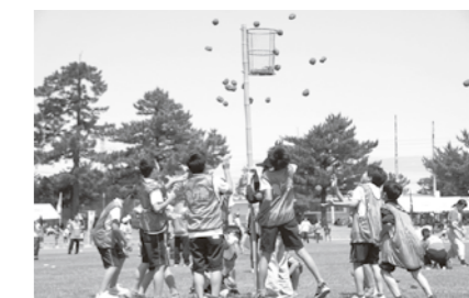
7月2日市民体育祭総合第4位