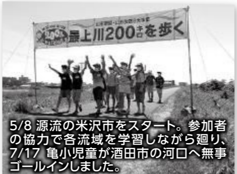
5/8 源流の米沢市をスタート。参加者の協力で各流域を学習しながら廻り、7/17 亀小児童が酒田市の河口へ無事ゴールインしました。