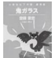
第52回ENEOS童話賞 優秀賞受賞