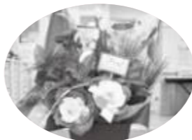
12月27日 フラワーアレンジメント研修会

当会は、亀ヶ崎地域の自治会女性会員で構成し、各自治会組織の自主性を尊重し、連絡・協調を図り明るく住みよい町作りに寄与することを目的としています。亀ヶ崎コミュニティ振興会の行事に、食生活改善推進協議会・社会福祉協議会と共に参加協力しています。この2年間は、コロナ禍でいろいろな事業を中止しましたが、7月プラウターへ花苗植栽、12月フラワーアレンジメント研修会を開催しました。