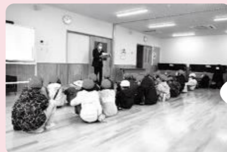
講座室では、会議やカルチャー教室を行っています。