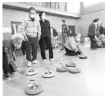
皆さんも参加してみませんか？ 楽しいよ～！

本協議会は、各種教養研修会の参加と健康増進の為にグラウンドゴルフ大会、輪投げ大会を各2回、花見と芋煮会等の季節の催しなど年5回程度実施してきました。昨年からは『コロナ』の影響もありグラウンドゴルフ大会を除き全ての大会は中止になりました。このような中、新コミセンも落成したのだから何か出来ないかと会員一同思案の末、カローリング大会を去年と今年、盛大に実施しました。